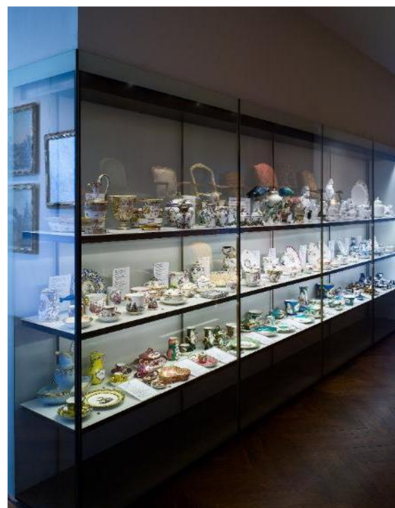
Salle de la porcelaine tendre à la porcelaine dure

Ce musée s'inscrit dans l'histoire de l'Union centrale des beaux-arts appliqués à l'industrie, fondée en 1864 afin de faire reconnaître les arts décoratifs et d'encourager le développement. Au fil du temps, cette institution change plusieurs fois de nom : elle devient l'Union centrale des arts décoratifs (UCAD) en 1882, puis Les Arts Décoratifs en 2004, avant de prendre le nom de MAD en 2018.