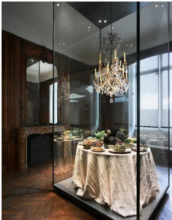
Salle Une boiserie à la capucine, 1730

Le musée des Arts décoratifs est situé à Paris, 107 rue de Rivoli, dans l'aile de Marsan du palais du Louvre. Il a pour vocation de mettre en valeur les arts décoratifs et d'établir un lien entre l'art, la culture et la production. Il abrite aujourd'hui l'une des plus importantes collections d'arts décoratifs au monde.