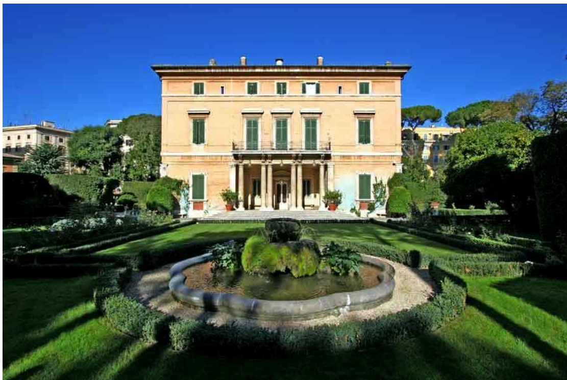
Villa Paolina, Rome

(‘Je laisse à la duchesse de Hamilton deux beaux vases de porcelaine de Sèvres, de ma chambre à coucher dans ma villa Paolina à Rome’)