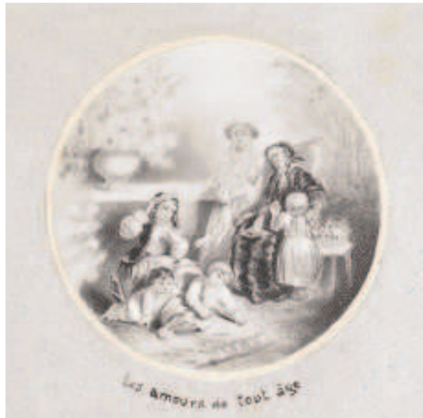
6. Les amours de tout âge , détail de la série Les bonnes mères de Rouger. Encre, lavis, rehauts de gouache, vers 1865-70. Recueil 69.