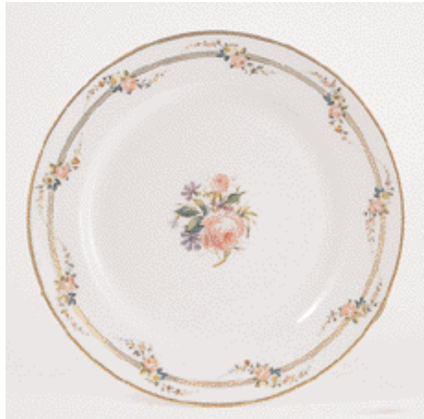
10. Assiette en porcelaine. Marque aux croissants imbriqués, J. Vieillard & Cie, Bordeaux. Pâte réplique d'une porcelaine bordelaise de la manufacture des Terres de Bordes en Paludate (1787-1790).