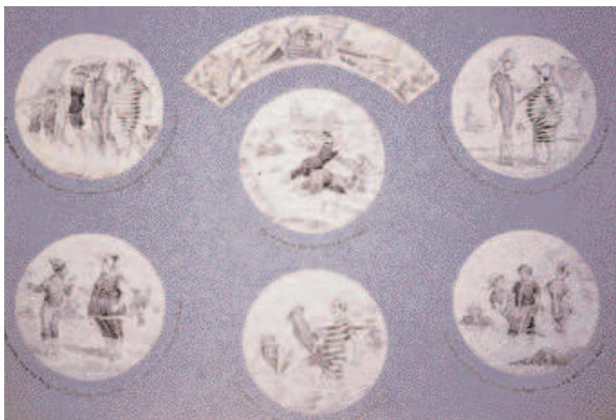
4. Aux bains de mer . Six vignettes et le dessin de l'aile de l'assiette. Anonyme. Encre et lavis. Recueil 72.

Un autre sujet plus typiquement bordelais est la corrida 17 . Dans la banlieue bordelaise, sous la III e République, les spectacles taurins connaissent un grand succès et des arènes en bois sont