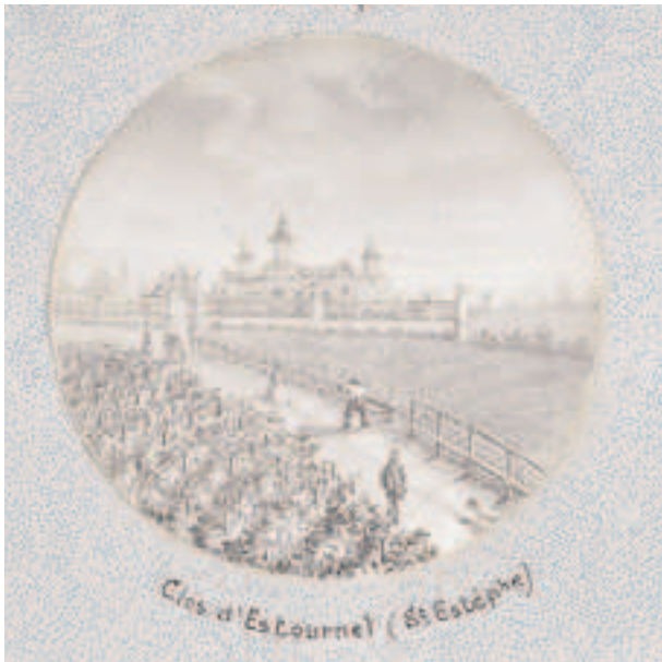
5. Clos d'Estournel (pour Cos d'Estournel ) de la série des Châteaux du Médoc de Lequet. Signature en bas à droite, A. Lequet. Encre, crayon, estompe. Recueil 71.