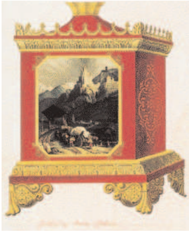
8. « Jardinière carrée à la galerie ». Aquarelle sur papier extraite du recueil 119. Archives municipales de Bordeaux. Vers 1854.

construites au Bouscat. La société du Taureau Sport bordelais sera fondée en 1893 et la course de vaches landaises est le « sport-spectacle » le plus populaire de Bordeaux, à côté de la course hippique réservée à la bourgeoisie 18 ... toutefois, l'existence à Gien d'une série sur la corrida vient démentir l'évidence d'un tel rapport !