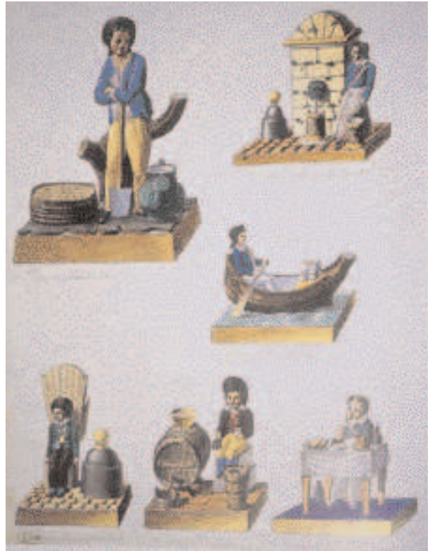
1. Quatre planches d'encriers extraites du recueil 119. Aquarelle sur papier, vers 1850-1860.