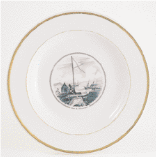
9. Assiette à décor imprimé « Le port de Sébastopol », porcelaine à la marque aux croissants imbriqués. Cette assiette garde de la porcelaine le liseré d'or et de la faïence fine, une vignette centrale imprimée. Provient d'une série inspirée par la guerre de Crimée (1854-1855).