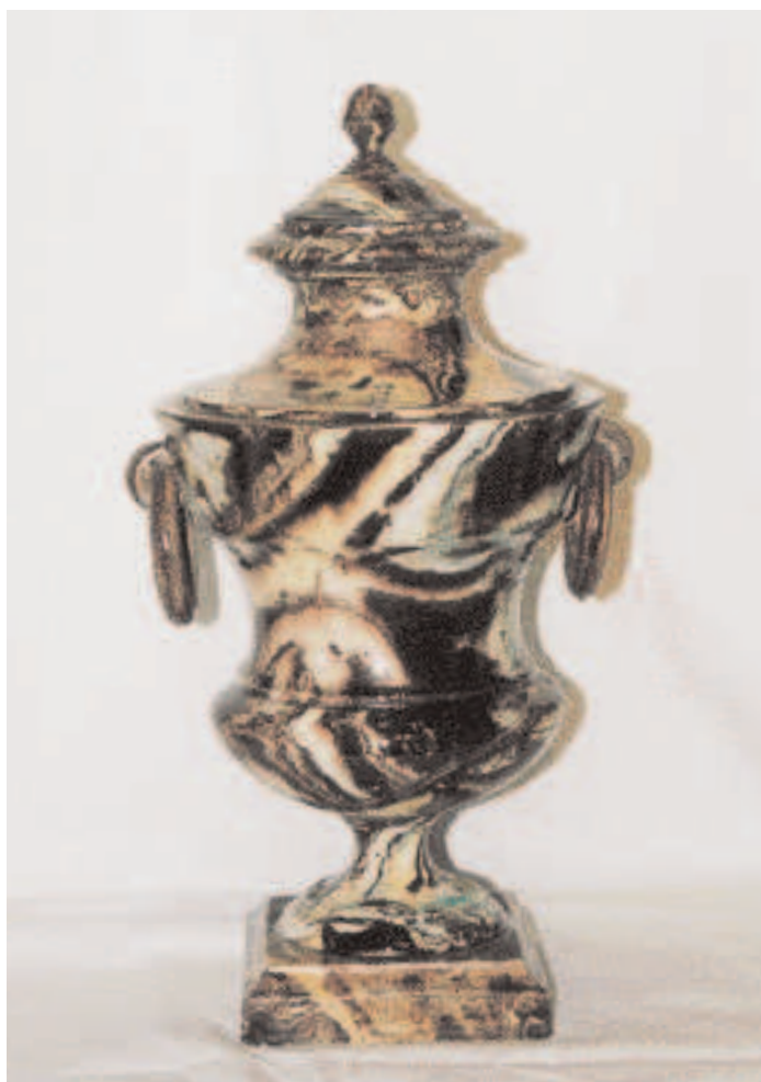
5. Grand vase couvert, faïence fine. Manufacture Alexandre Grammont, Orléans, vers 1790-1815, marque en creux : « FABRIQUE / À ORLÉANS ». H. 0,37 ; D. 0,21. Orléans, coll. particulière.

L'ensemble de cette production présente des