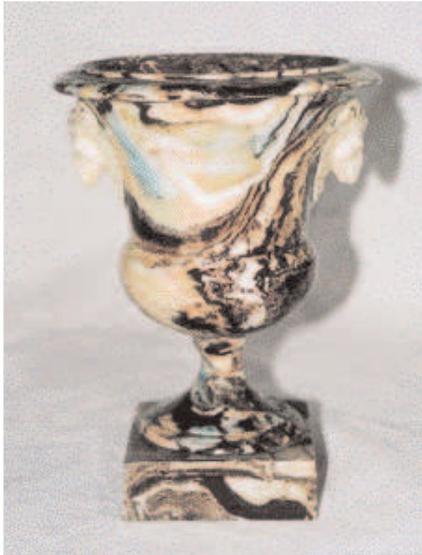
1. Vase Médicis, faïence fine. Manufacture Alexandre Grammont, Orléans, vers 1790-1815, marque en creux : « GRAMMONT / L'AÎNÉ FABRIQ r / À ORLÉANS ». H. 0,21, D. 0,16. New York, coll. Les Pierres.

produisaient des objets courants : « les culs bruns ». Il s'agit d'une faïence utilitaire et rustique. Ces produits d'usage domestique étaient fabriqués avec un mélange d'argiles plastiques, de marnes argileuses et calcaires et de sable 9 , composition qui leur donnait une bonne résistance à la chaleur. La faïence obtenue est de couleur brune. Le revers des pièces est recouvert d'une glaçure brune, couleur justifiant l'appellation « cul brun ». Ces plats et ces assiettes au bord parfois contourné sont recouverts généralement d'un décor peint très sommaire représentant le plus souvent une corbeille fleurie. Cette production n'est pas typique de l'Orléanais ; Bordeaux, Tours ainsi que d'autres centres en ont également produit.